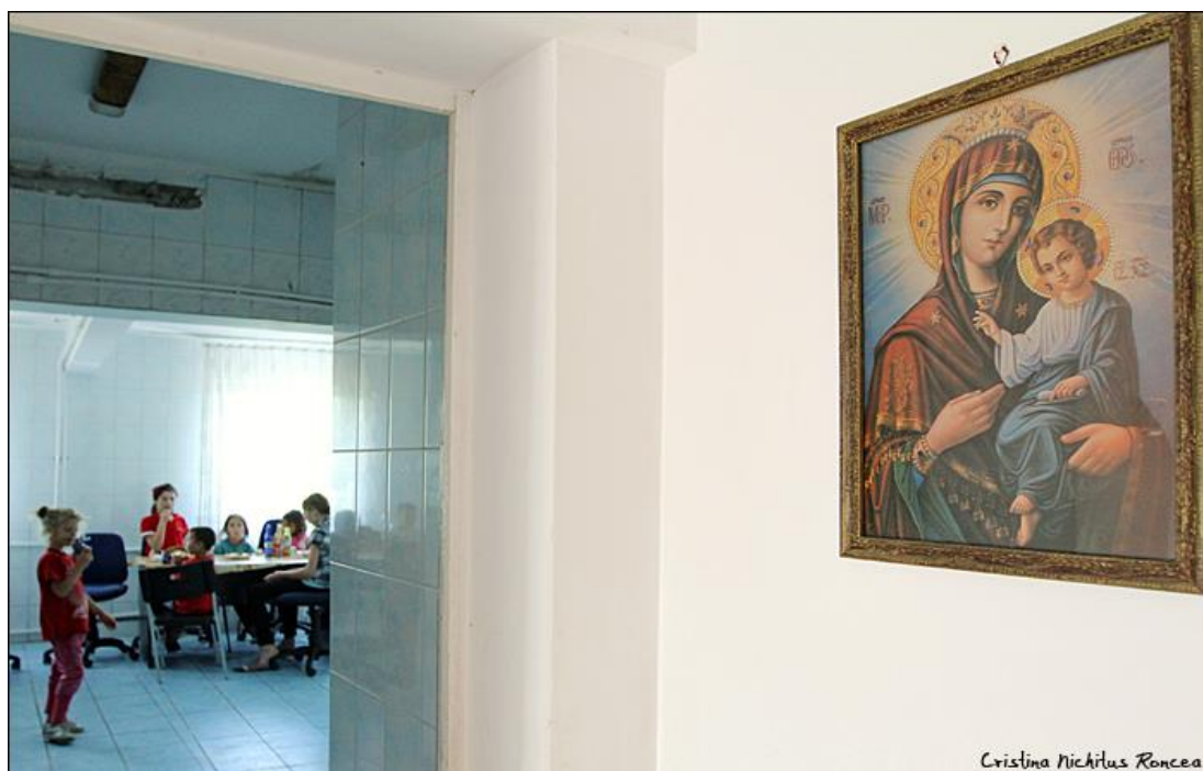
SALA DE MESE DE LA AȘEZĂMÂNTUL „SFINȚII ARHANGHELI”

Detalii pe blogul www.potisalvaoviata.ro . Numărul de beneficiari deserviți: direct și indirect, 55-60 de persoane.